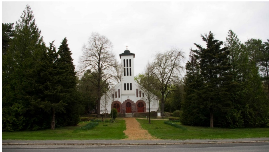
A Nagyboldogasszony római katolikus templom (Rákóczi út 53.), előterében egy feszülettel (utóbbi nem szerepel a TÉKA adatbázisban)

A TÉKA adatbázisban 8 db egyedi tájértéket rögzít, amelyek döntően a Rákóczi parkban kerültek felvételre (pl. Ezredforduló kapuja, Rákóczi-fa kopjafája, Wass Albert emlékmű), de a felmérés nem tekinthető teljeskörűnek. A hatályos településrendezési eszközök helyi értékvédelmi területet rögzítenek, amely változással érintett területet is magában foglal (I.2.A, B, I.5., II.6.).