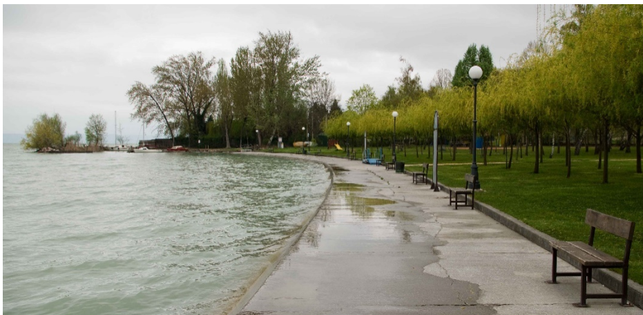
A strandokra is jellemző a morfológiai átalakítottság: módosított part-vonalvezetés és vasbeton partvédő művek

Jelentős pontszerű szennyezőforrások (pl. kommunális/ipari szennyvíz bevezetés élővízbe) nincsenek a településen, diffúz terhelést a felszín alatti és felszíni vizek számára elsősorban a nagyobb utakról, parkolókról lemosódó szennyezőanyagok (elsősorban az I.2.B, I.3., I.5. területek környezetében), illetve a szántókon alkalmazott növényvédőszer, műtrágyák jelenthetnek (I.1., II.7. terület környezetében). A parti sávban szezonálisan jelentős a fürdőzők hatása lokálisan a vízminőségre (üledék felkeverése, szervesanyag terhelés)(pl. II.2., II.3., II.4. területek környezetében). Jelentős, lokális vízkivétellel járó létesítmény (pl. nagyobb ipari, mezőgazdasági üzem) nincs a településen. A felszíni vizek esetében a terhelésekhez sorolható a Balaton partjának és vízszintjének szabályozottsága (II.2., II.3., II.4. területek környezetében).