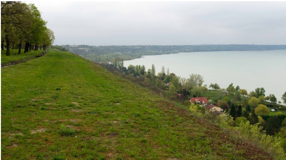
A Kisfaludy sétány környezete tájképi szempontból meghatározó tájrészlet

A speciális domborzati és földtani adottságok tájképi szempontból is meghatározóak : elsősorban a Kisfaludy sétány környezetéből tárulnak fel nagy távlatokra látványok, a magaspartra és koronavonalának környezetére más tájrészletek felől is rálátás nyílik. (A területrendezési tervek tájvédelmi vonatkozásait a 2.2.2. és a 3.4.2. fejezetek rögzítik.)