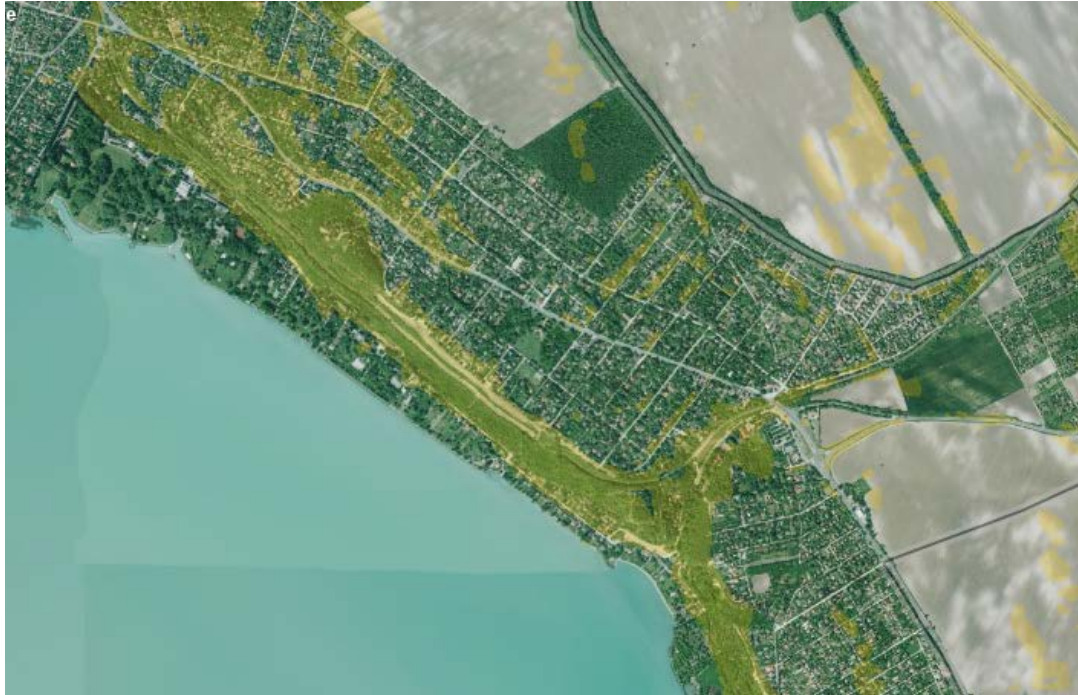
A magaspart jelentős része 17%-nál meredekebb lejtésű – az erózió veszélyeztetett területek elhelyezkedését a sárga fedvények mutatják (több változással érintett területnél releváns)

A Mezőgazdasági Parcella Azonosító Rendszer alapján a település jelentős része (a földtani/talajtani és domborzati adottságok miatt) potenciálisan erózióra érzékeny .