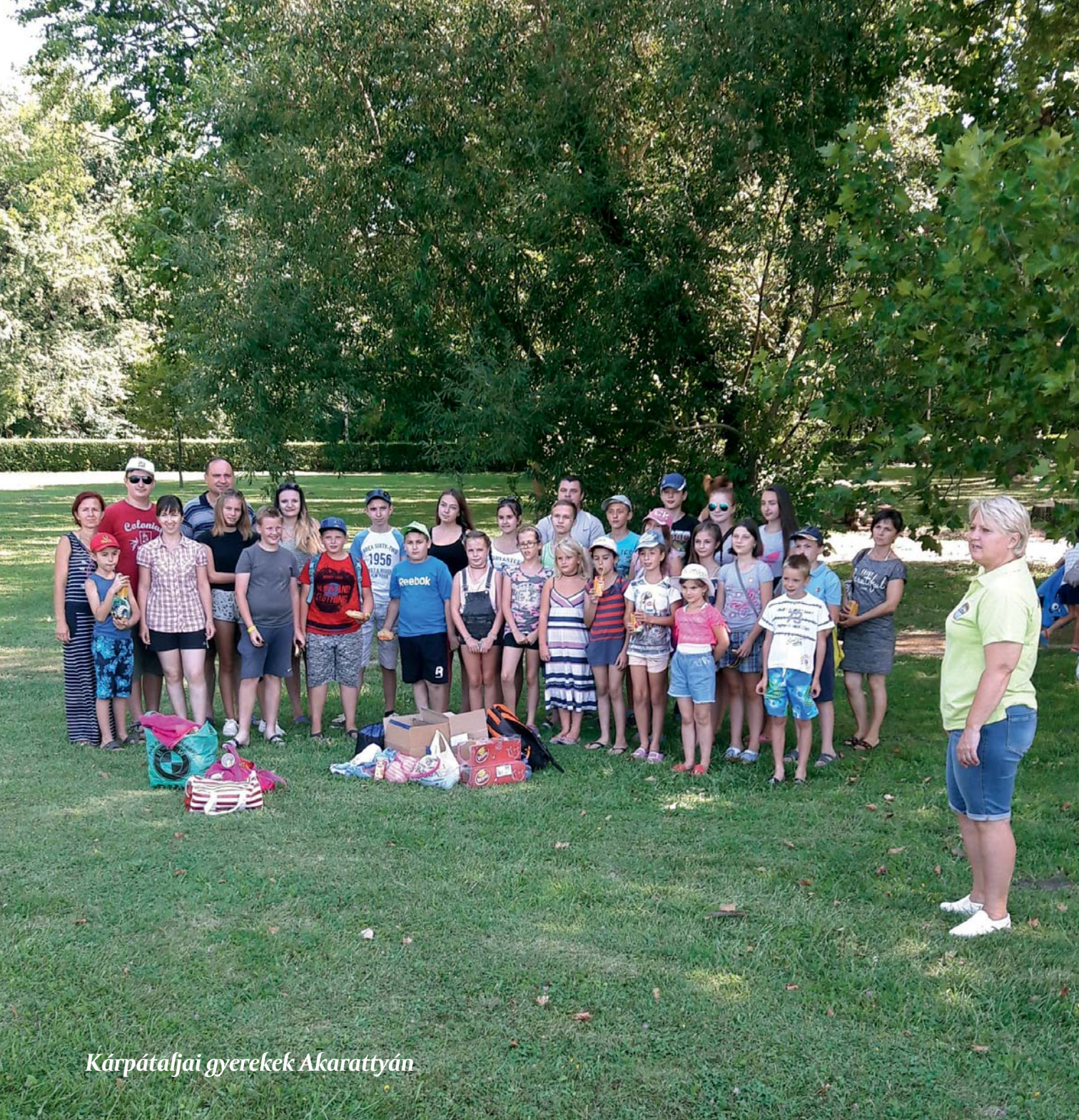
Kárpátalfjai gyerekek Akarattyan